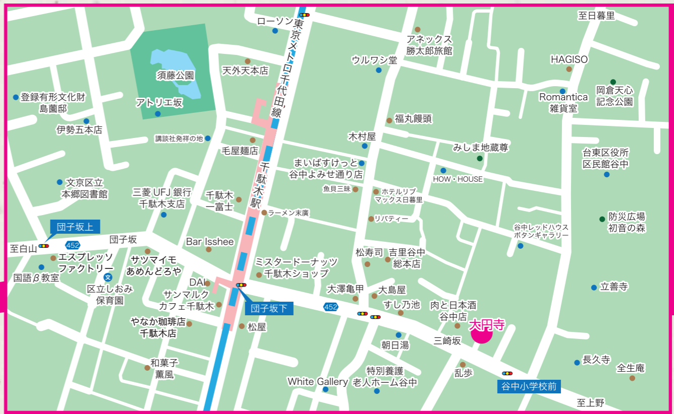
周辺拡大図 (千駄木駅から大円寺)